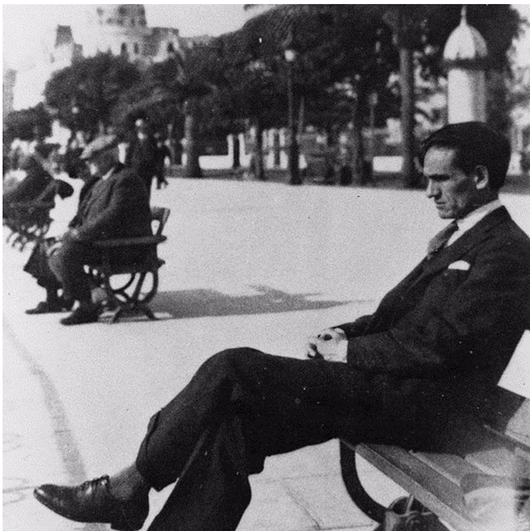
César Vallejo en París, 1924