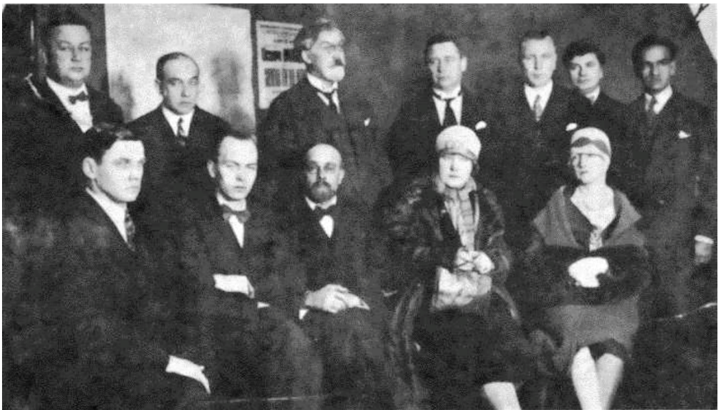
Vallejo en una reunión de escritores soviéticos. Moscú 1928